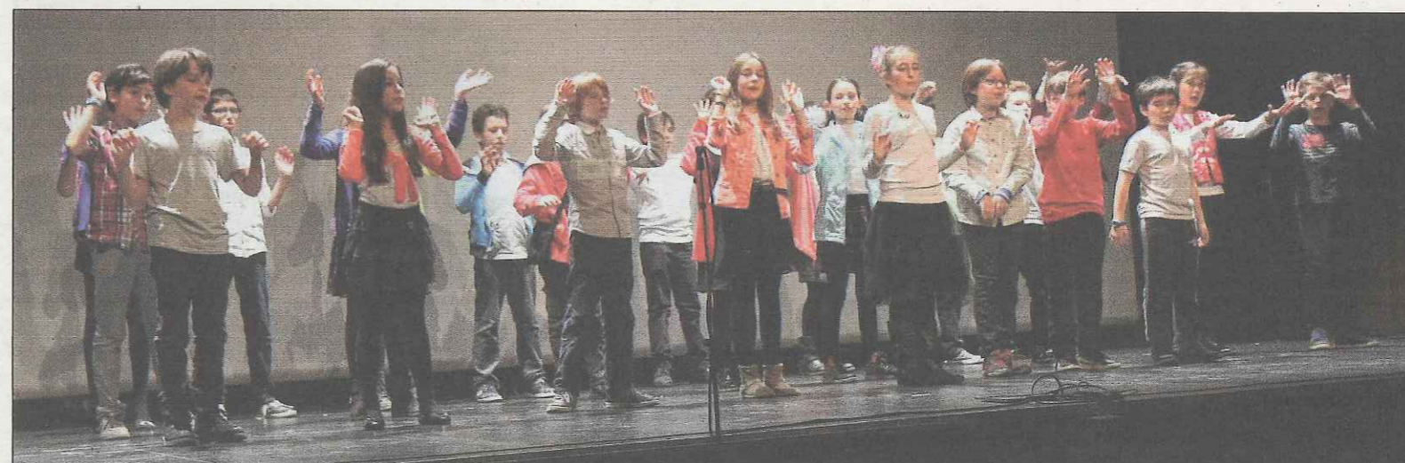
Les élèves de 6 e sur la scène de l'Agora pour un spectacle qui a enchanté leurs parents et leurs professeurs.

Le Centre international a fêté sa section et l'entrée dans l'année de la Chèvre